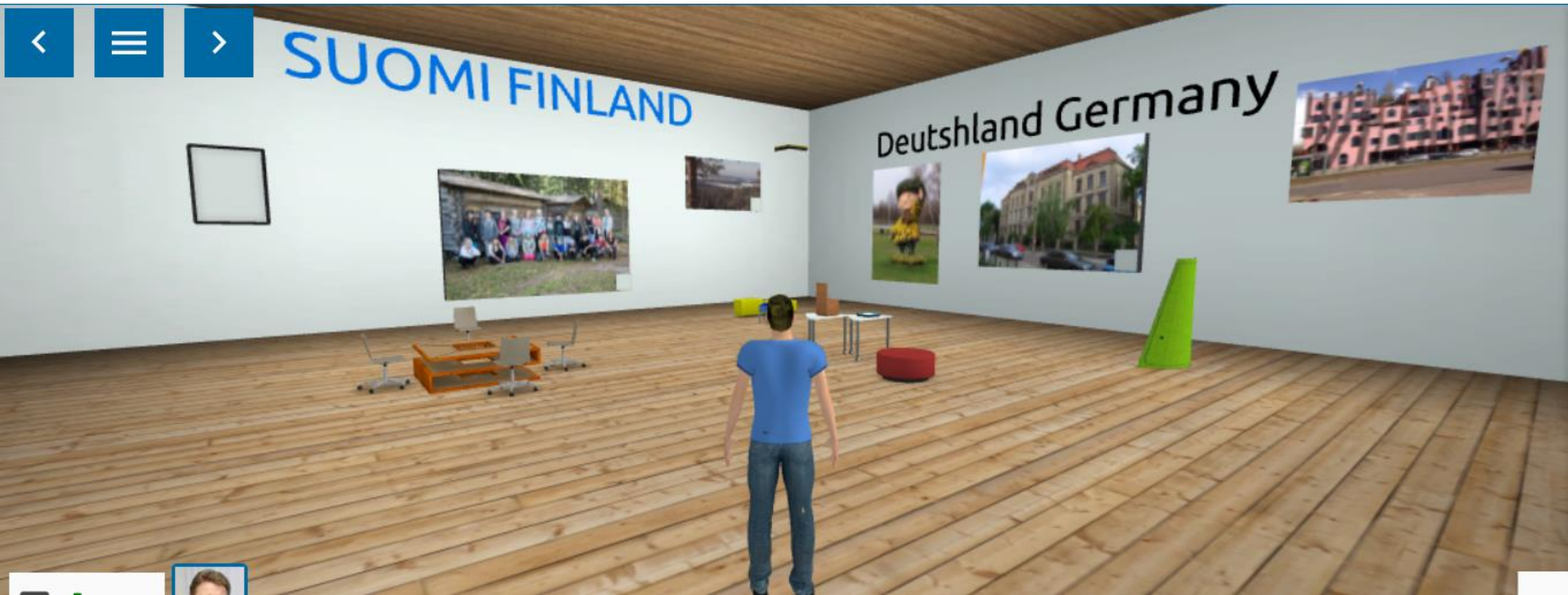
FinPeda Oy:n MESHMOON selainpohjainen virtuaaliluokka / -ympäristö