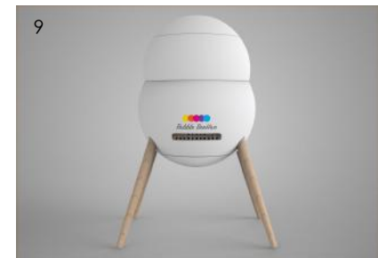
5-9. PROGETTI DI ARNIE IN CITTÀ