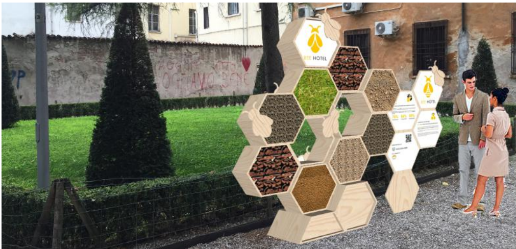
1. FOTOMONTAGGIO DEL PROGETTO BEE HOTEL MANTOVA ALL'INTERNO DI PARCO PALLONE NEL PALAZZO DUCALE DI MANTOVA

La semplicità dell'oggetto e l'uso dei materiali di recupero ha l'obiettivo di invogliare i cittadini a costruirne anche uno a casa.