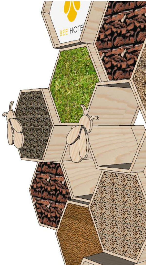
3. RENDER DEL PROGETTO BEE HOTEL MANTOVA