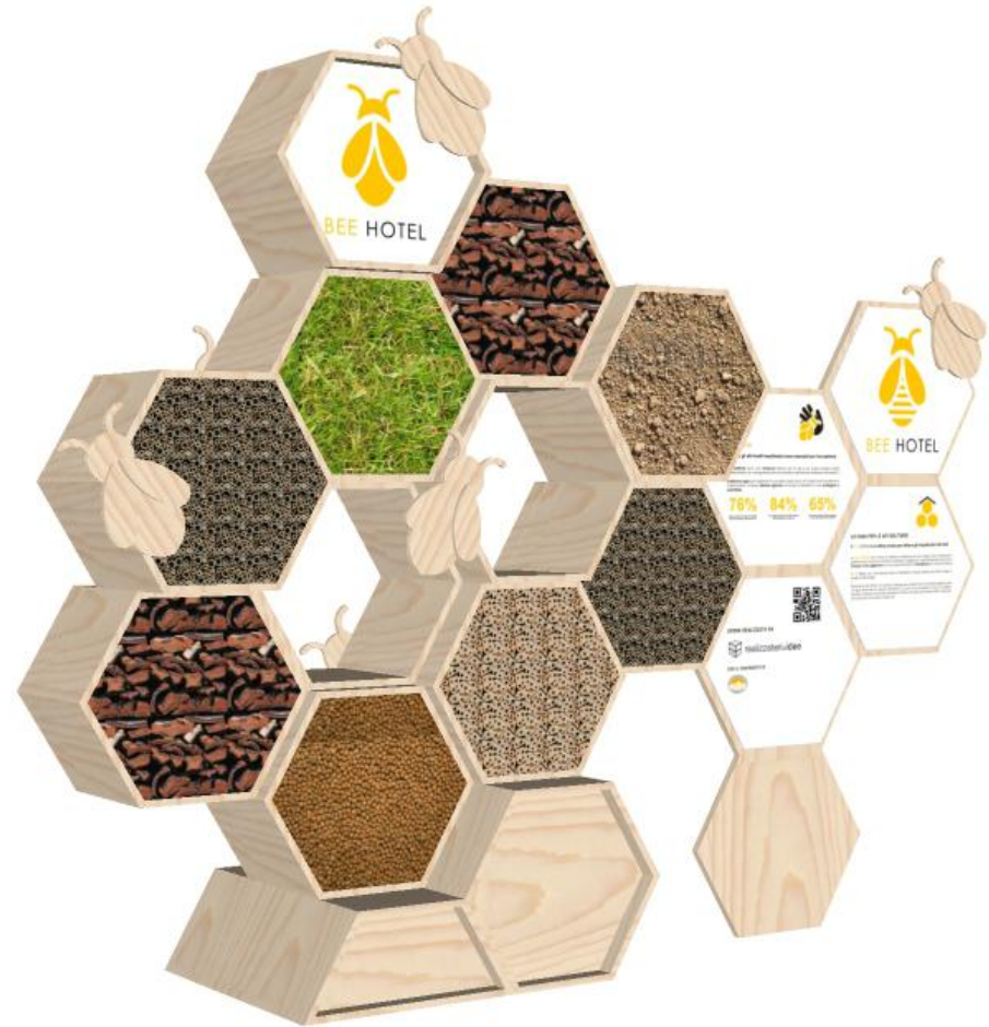
2. RENDER DEL PROGETTO BEE HOTEL MANTOVA

Il totem esplicativo che riprende le stesse forme svolge la funzione didattica.