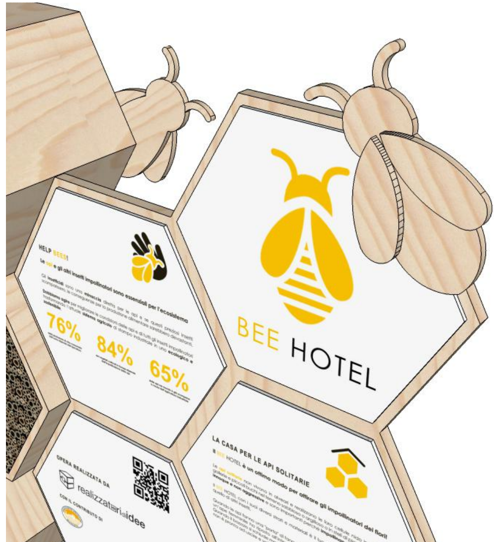
4. DETTAGLIO DEL TOTEM ILLUSTRATIVO DEL RENDER DEL PROGETTO BEE HOTEL MANTOVA